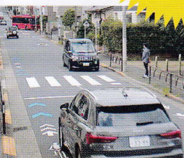
検証 横断歩道の一時停止率は?