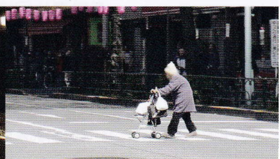
高齢歩行者 右側からの横断事故

¥70,000(税別)DVD [本編19分 | 字幕付 | 16:9 | カラー]